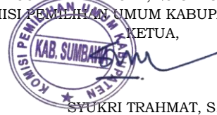
SYUKRI TRAHMAT, S.Ag

SUMBAWA BESAR, 25 OKTOBER 2017 KOMISI PEMBILANGAN SUMUM KABUPATEN SUMBAWA KETUA,